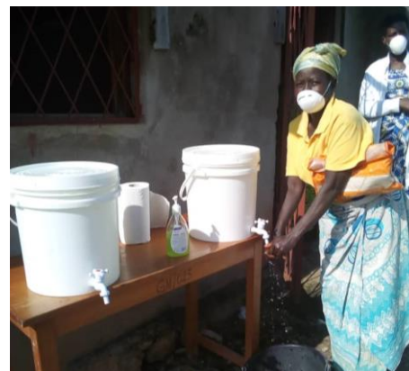
Händewaschen schützt vor Infektionen.