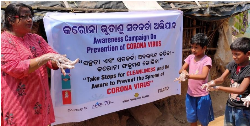
Mit Präventionsmaßnahmen wird in Indien gegen die Ausbreitung des Corona-Virus gekämpft.