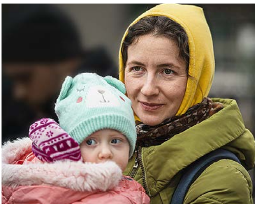
Geflohen vor dem Krieg: Mutter und Tochter benötigen Schutz in einer beheizten Notunterkunft

An den Grenzen spielen sich dramatische Szenen ab: Frauen und Kinder verabschieden sich von ihren Männern und Vätern, die in der Ukraine zurückbleiben - ein Abschied ins Ungewisse.